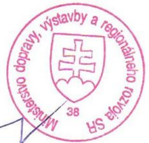
Ing. Ján Počiatek minister dopravy, výstavby a regionálneho rozvoja SR